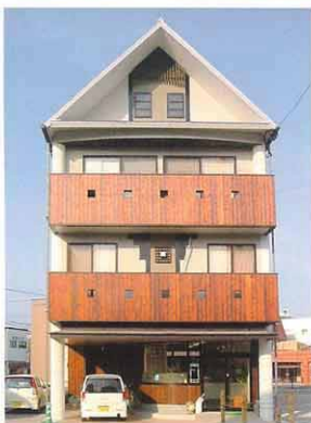
セルトン美富室/上野邸・正面ファサード 中津駅前島田本町の景観条例による和風仕立

人の嗜好は千差万別。家造りに対する思いも十人十色。しかし、出来上がる住宅は、1つきりです。その時の資金力・環境等、現実的に大きく左右される事情も多々有る事でしょう。何を優先させるのか？共に考え交通整理しながら、少しでも夢の実現に近づけるよう、設計事務所ならではの企画力・デザイン・知識を持って、アドバイス致します。住まいは、その住まい手の心を映し出す鏡の様なものだと思っています。