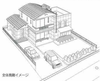
全体鳥瞰イメージ