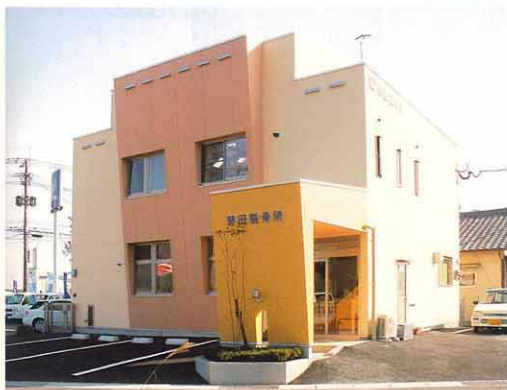
野田病院/野田邸・北側外観 シンプルを一部斜め壁でダイナミックに表現